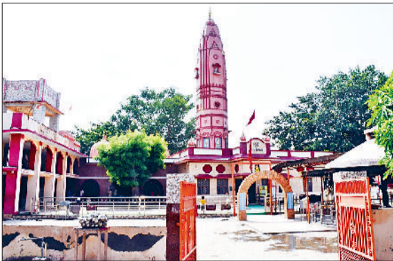
भिवानी। जोगीवाला शिव मंदिर।

23 जुलाई को श्रावण माह की शिवरात्रि मनाई जाएगी। शिव भक्त कांवड़िए हरिद्वार, गंगोत्री, गौमुख व नीलकंठ से झूला, बैठी व खड़ी कांवड़ में गंगाजल लेकर भिवानी पहुंच रहे हैं। इसके साथ ही उक्त धार्मिक स्थलों से डाक कांवड़ लेकर शिवभक्तों का समूह रवाना हो चुका है, जो दौड़ता एवं डाक लगाते हुए शिवालयों में सीधे शिवलिंग पर जलाभिषेक करेंगे। शिवभक्त 23 जुलाई को भगवान शिव का उपवास रखकर उनकी अराधना करेंगे और परिवार की सुख-समृद्धि की कामना करेंगे। शिवरात्रि पर्व पर छोटी काशी के शिवालय बम-बम भोले व हर-हर महादेव के जयघोष से गूंजेंगे। उल्लेखनीय है कि 11 जुलाई से श्रावण माह शुरू और नौ अगस्त को समाप्त होगा। श्रावण माह की शिवरात्रि पर छोटी काशी के शिवालयों में बम-बम भोले व हर-हर