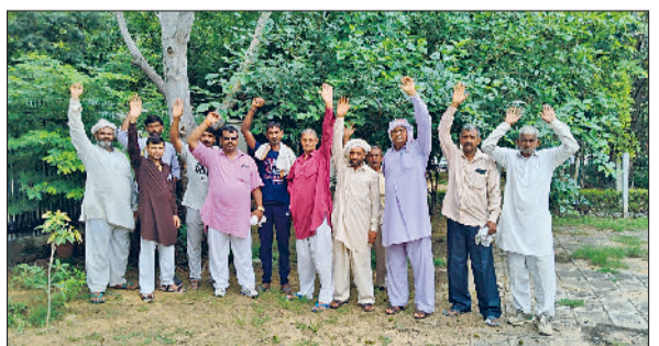
भिवानी। पानी की मांग को लेकर नारेबाजी करते ग्रामीण।

चहुंओर पानी को लेकर हाहाकार मचा है। कहीं पर पानी ज्यादा जमा होने से लोगे बेहद परेशान हैं। कहीं पर पीने के पानी की भयंकर किल्लत बनी है। ऐसा ही वाक्या गांव मानहेरू के ग्रामीणों के साथ बना हुआ है। दादरी डिस्ट्रीब्यूटरी पानी से लबालब है, लेकिन मानहेरू