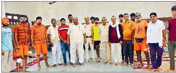
दिगावा मंडी। कांवड़ियों की सेवा में खड़े श्रद्धालु।

महादेव के जयघोष गूंजेंगे। श्रावण माह में जोगीवाला शिव मंदिर, बाबा हरगिरि आश्रम, जोहड़ीवाला हनुमान मंदिर शिवालय, स्यालाल पुरी मंदिर, टेकसुजी शिव मंदिर, होरापुरी मंदिर, जोहड़ वीर मंदिर व सिद्धपीठ लाल महादेव अखाड़ा वाला मंदिर सहित शहर के अनेक शिवालयों में श्रावण माह की शिवरात्रि के अर्धरात्रि को ही बम-बम भोले व हर-हर महादेव के जयघोष के साथ शिवलिंग पर जलाभिषेक होगा।