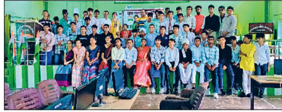
बवानी खेड़ा में वीर शहीद कपिल देव राजकीय मॉडल संस्कृति विरिष्ठ माध्यमिक विद्यालय में युवा संसद कार्यक्रम में उपस्थितजन एवं मुख्यातिथि को सम्मानित करते हुए।

वीर शहीद कपिल देव राजकीय मॉडल संस्कृति तमावि में युवा संसद कार्यक्रम का आयोजन