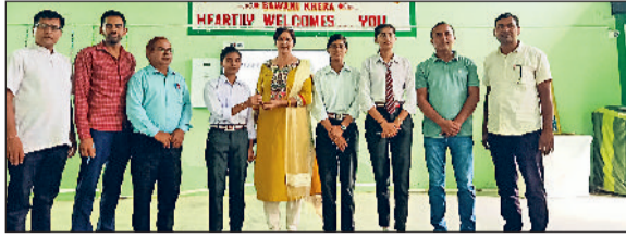
बवानी खेड़ा में वीर शहीद कपिल देव राजकीय मॉडल संस्कृति विरिष्ठ माध्यमिक विद्यालय में विज्ञान प्रश्नोत्तरी प्रतियोगिता में सम्मानित करते हुए।