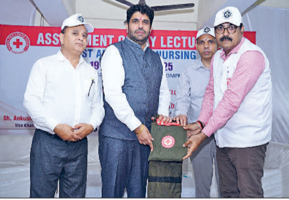
प्राथमिक सहायक प्रवक्ताओं को सम्मानित करते अतिथि।