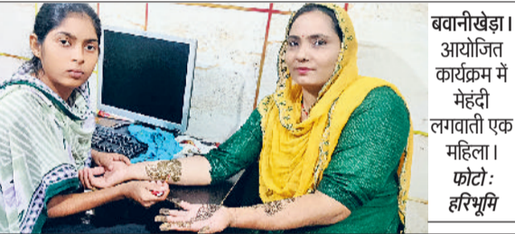
भवानीखेड़ा। आयोजित कार्यक्रम में मेहंदी लगावती एक महिला।