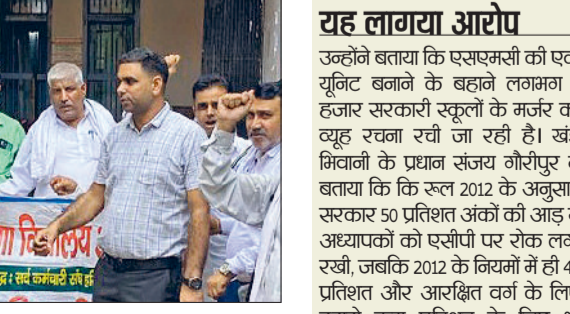
भिवानी। मांगों को लेकर ज्ञापन सौंपते हुए।